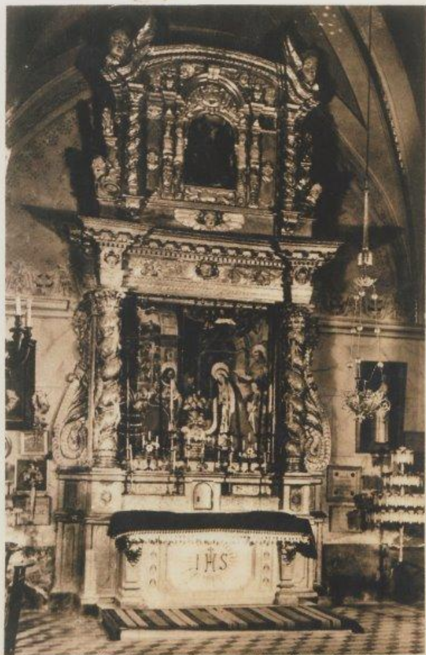
B.E.F. 8 Les Arcs-sur-Argens - Chapelle de Ste-Rodoline Autel de « La Nativité », primitif du XVI e siècle