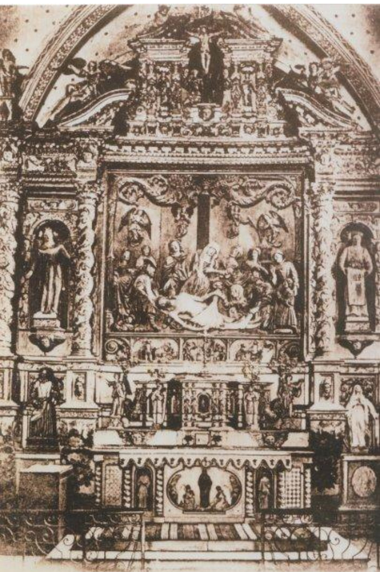
Les Arcs sur-Argens. - Chapelle Ste-Roseline Rétablo de l'Autel Majeur (XVI e siècle)