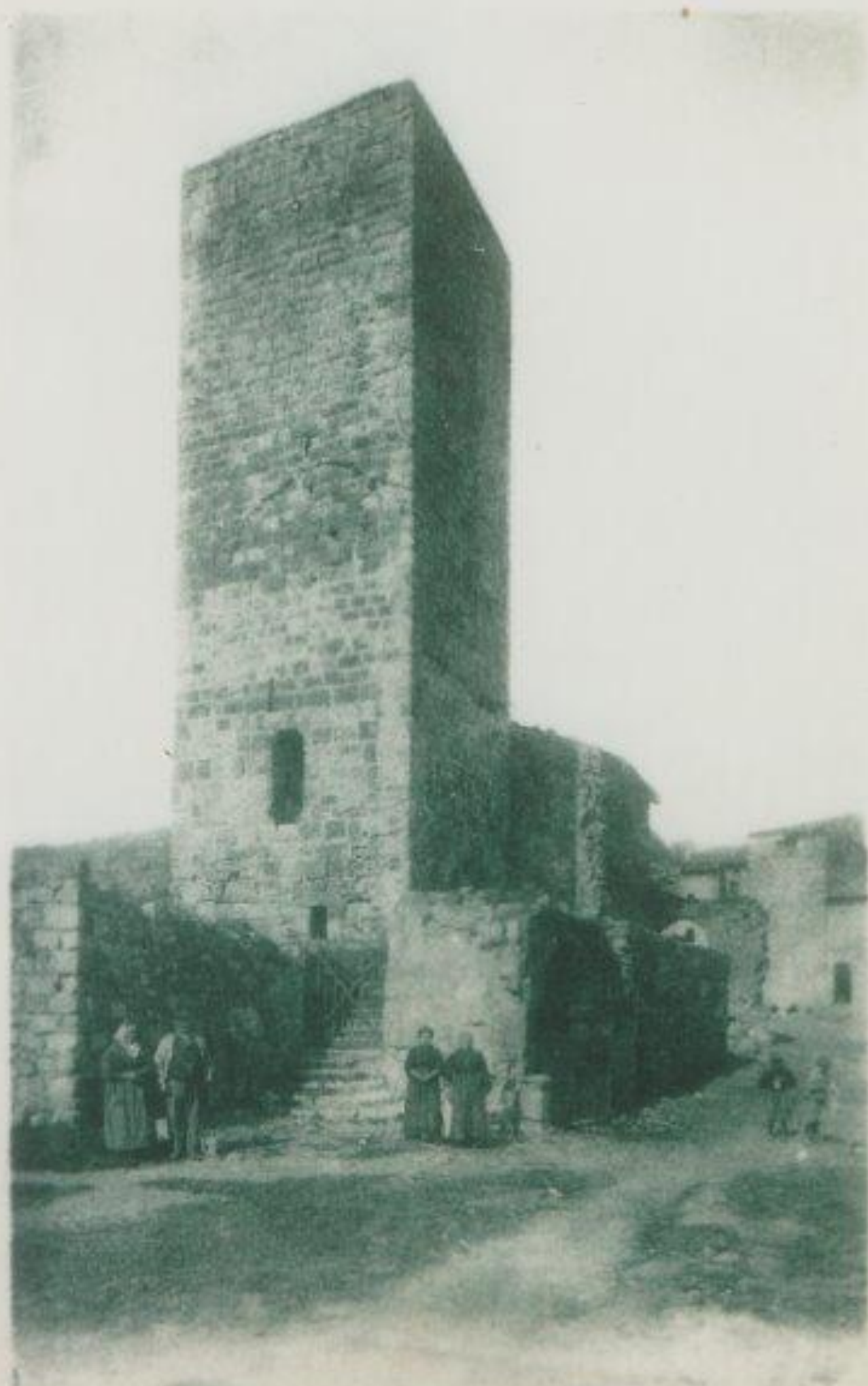
Les Arcs — La Tour de Villeneuve