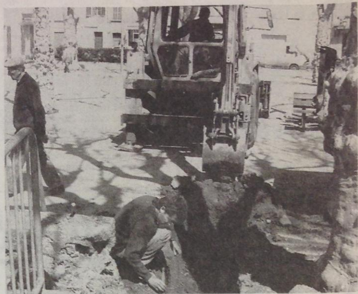
Coup d'envoi des travaux par la pose d'un important pluvial traversant le boulo-drome.

L'homme de l'art a prévu un plan d'eau de 7 m de long avec un fronton semi circulaire. L'accès à la fontaine s'effectuera par